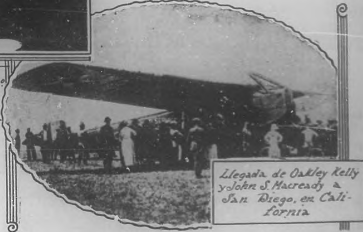
Llegada de Oakley Kelly y John S. Macready a San Diego, en California.