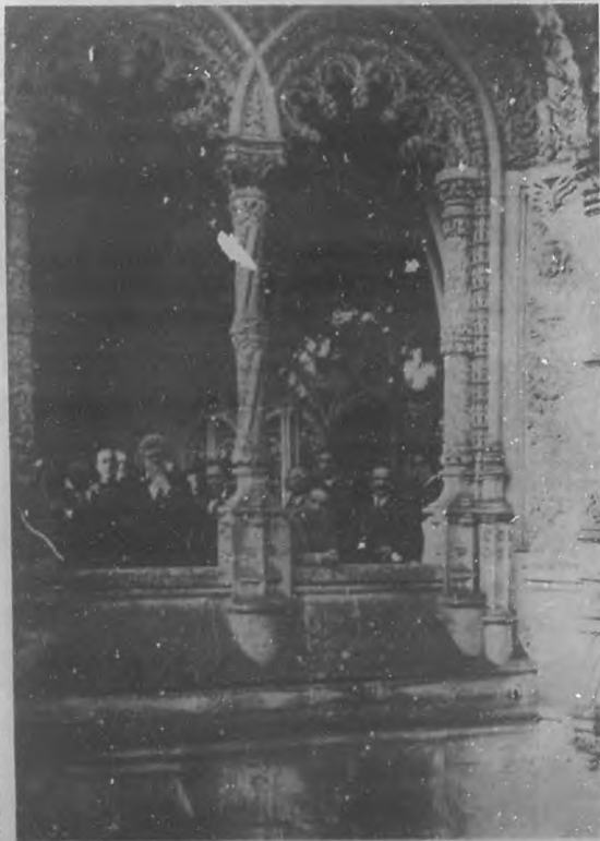
EL CONGRESO DE LA PRENSA LATINA EN LISBOA.—Visita de los periodistas latinos al maravilloso palacio de Bussaco, ex-residencia real.

cias comedias que terminan siempre con gritos nasales y "a palo limpio".