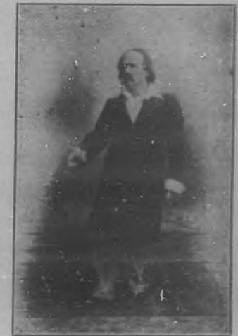
¡Polavieja! Cuántas cosas tu apellido me recuerda!