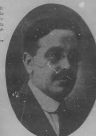
SR. JOSE SOBRINO Prestigioso periodista, que se ha hecho cargo de la administración general del diario "El País".

bres públicos de nuestro país, que olvidando sus sagrados deberes morales y patrióticos, han hecho y hacen granjería vil y punible, de los intereses nacionales y escarnio de los nobles postulados del derecho y la justicia, hermosas conquistas de la