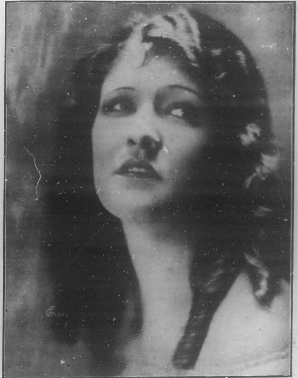
SORANDO CON EL AUSENTE

Lo de "multicolores" podría sonar raro si no fuese rigurosamente exacto. Casi todos los edificios de Lisboa están colorados asimétricamente por las desigualdades topográficas del terreno y constan de varios pisos de poco puntal, techados con tejas que terminan sobresaliendo un tanto de las planas fachadas. Los tejados, según sean nuevos o no, presentan variadas tonalidades desde el color "ladrillo encendido" hasta el negro verduzco. Las fachadas pintadas de arriba abajo con colores sencillos, primitivos casi siempre; las ventanas de otro color y las rodea un